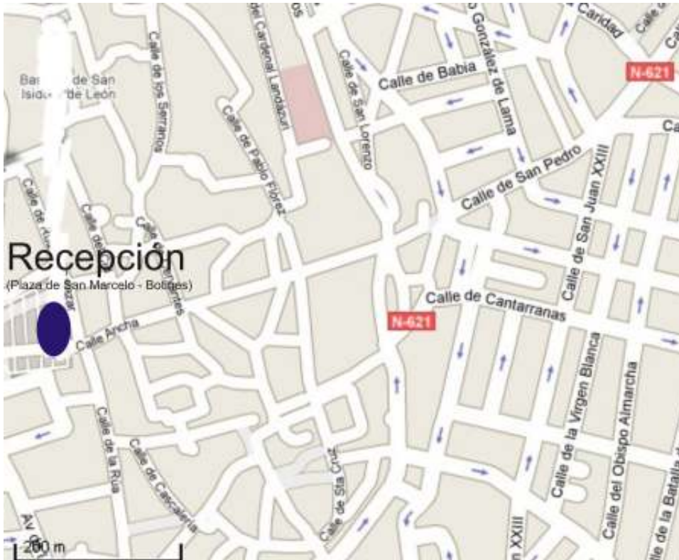
Lugar de recepción: Plaza de San Marcelo (Edificio de botines)